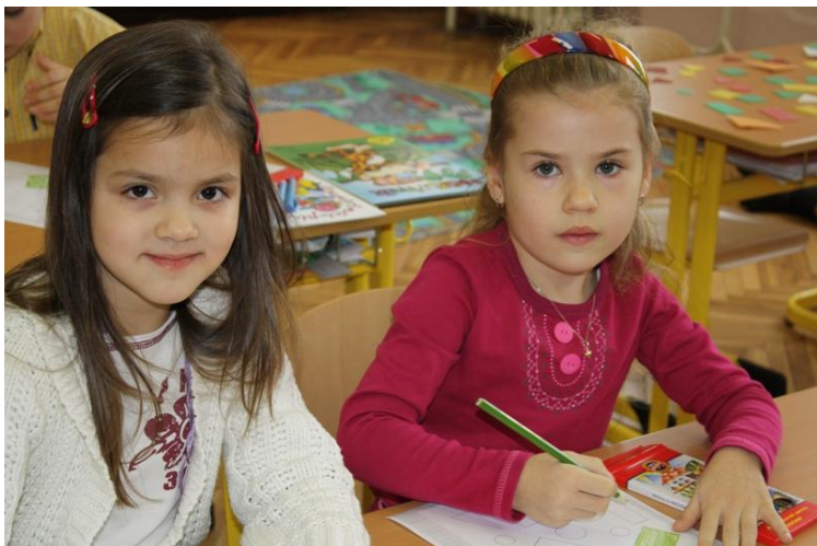
Prvňáčky – ZŠ D.Věstonice